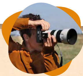
FOTO – VOM KNIPSEN ZUM FOTOGRAFIEREN