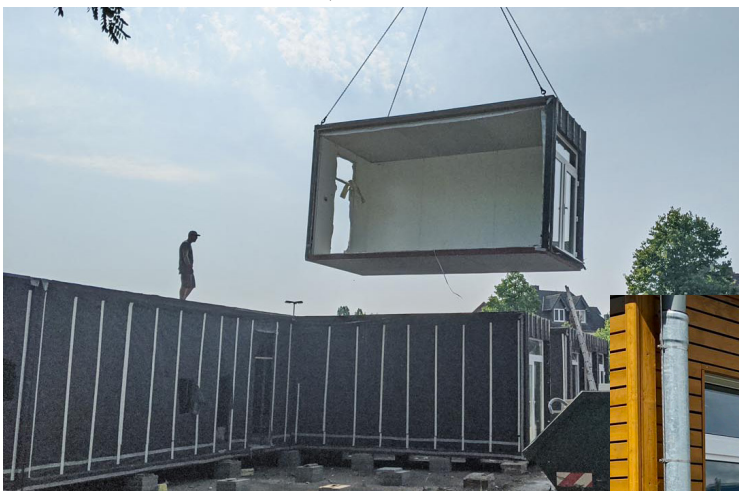
Der Container an der Regenbogen-Schule während des Abbaus ...

In Eschborn wird die Laufbahn der Hartmutschule erneuert, außerdem erhält sie eine Tribüne aus Steinquadern. Die Kosten werden auf 200.000 Euro beziffert,